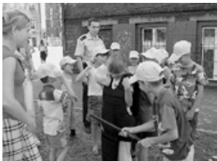
na fotografii: uczestnicy kolonii przy mierzącej dopiero co otrzymane „firmowe” czapeczki