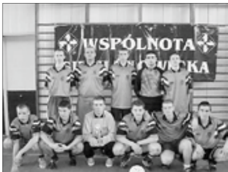
na fotografii: zwycięzcy jednej z pierwszych edycji „Czterech pór roku” – drużyna ZSTIO „Meritum”