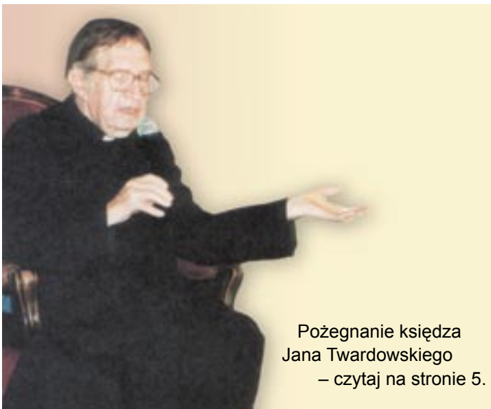
Pożegnanie księdza Jana Twardowskiego – czytaj na stronie 5.