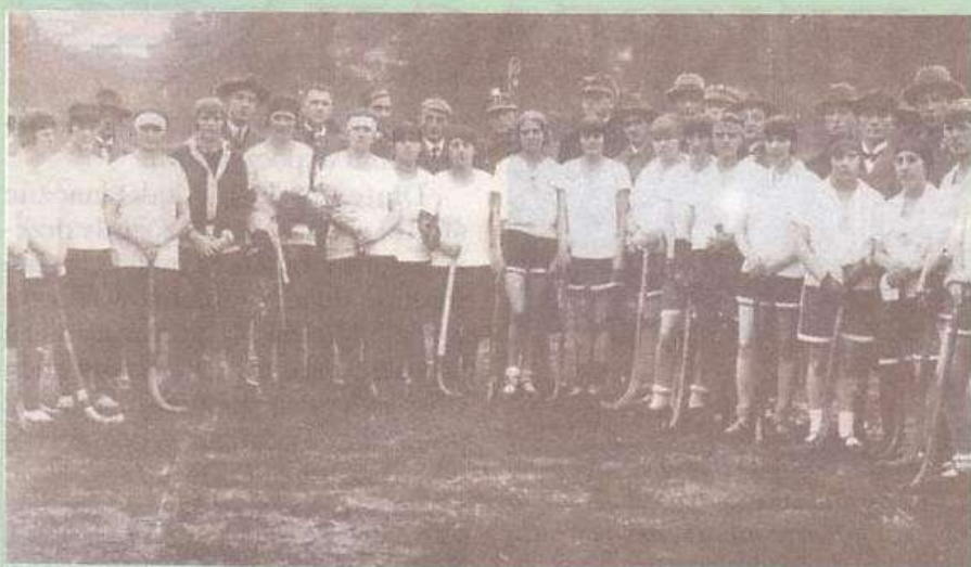
Hokeistki Klubu Hokejowego „Siemianowice” z zawodniczkami Poznańskiego Towarzystwa Hokejowego po meczu rozegranym w Poznaniu - 25 września 1927 roku.

gazeta niemiecka „Oberschleisische Zeitung” z 1927 roku. Z danych zawartych w tym piśmie wynika, że na Śląsku działały wówczas następujące żeńskie kluby hokejowe: Preussen 06 Ratibor, Beuthen 09, VfL Beuthen, SV Borsigwerk, Beuthener Hockey Club oraz nasz siemianowicki - Hockey Club Laurahütte.