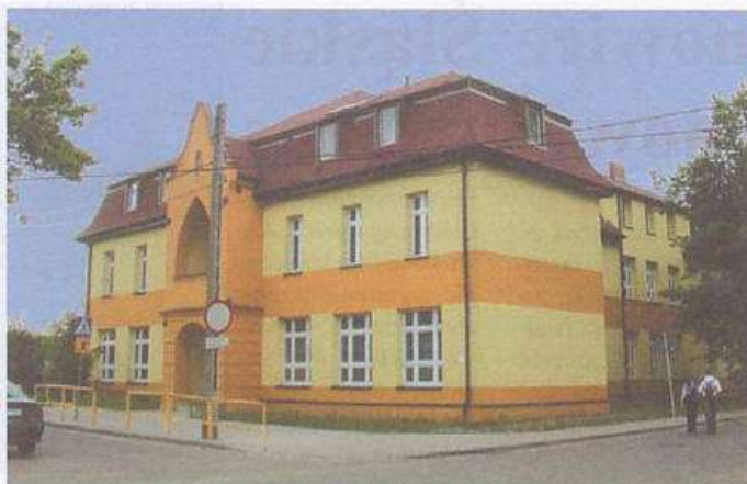
Szkoła Podstawowa nr 13 (wraz harcówką) po termomodernizacji to... pałac. Podobnie wypiękniał Zespół Szkół Techniczno-Usługowych przy ul. Matejki. Co roku tak się zmieni jedna szkoła.

Pośród rozlicznych dokonań wskazać trzeba na wyremontowanie przez miasto budynku przy ul. 1 Maja (b. gmach PZPR) dla potrzeb prokuratury oraz przy ul. Chorzowskiej (dawna szkoła podstawowa) na Sąd Grodzki. Już w IV. kadencji opracowany został projekt rozbudowy sądu. Prace ruszą wtedy, gdy partner tej inwestycji - Ministerstwo Sprawiedliwości - przeznaczy na ten cel swoją część pieniędzy. Wspomnieć jeszcze trzeba o budowie dużego ronda u zbiegu