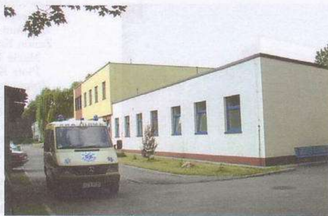
Nowa siedziba przychodni przyszpitalnych (a była tam ongiś m.in. kotłownia) to jeden z wielu przykładów przemian w publicznej służbie zdrowia finansowanej przez miasto. Standard przychodni i zmodernizowanych oddziałów szpitalnych to naprawdę XXI wiek.

Od podstaw zbudowane zostały dwie nowe ulice - Słoneczna (środkowa część) w Przelajce i ks. bp. Domina w Michałkowicach. W tejsze dzielnicy zrealizowana została już pierwsza część wieloletniej inwestycji kompleksowej wymiany sieci kanalizacyjnej oraz nawierzchni ulic i chodników. Nadto w całym mieście doszło do remontów wielu